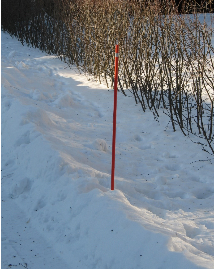
Joonis 3. Markiirpost, kuvatõmmis internetist