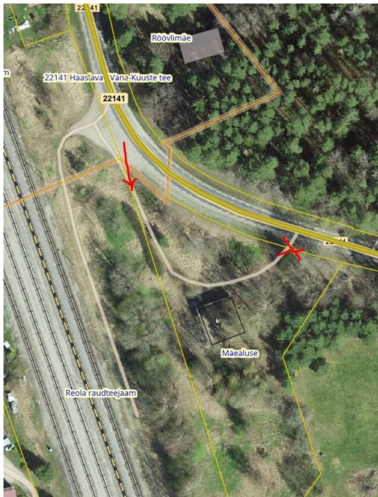
Joonis 1. Riigitee km 6,77 ristumiskoht, väljavõte Maa-ameti geoportaalist