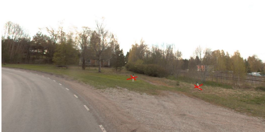
Joonis 2. Vaade juurdepääsule, seisuga aprill 2023